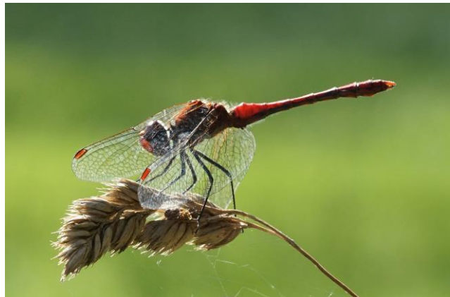
Eine Heidelibelle schützt sich mit den Flügeln vor der intensiven Sonneneinstrahlung

Der Vortrag gibt einen Einblick in die Gestaltung und Formenvielfalt der Insekten. Der Schwerpunkt der Beispiele liegt dabei im heimatlichen Bereich in der Umgebung von Minden: im eignen Garten in Stemmer, in der Biologischen Station im Heisterholz, im Hiller Moor. Einige „Ausländer“ bereichern zudem die Auswahl. Berührt werden dabei Themen wie Ernährung und Fortpflanzung, auch evolutionäre Aspekte kommen zur Sprache.