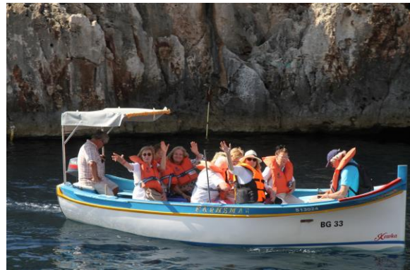
Eine fröhliche Bootstour