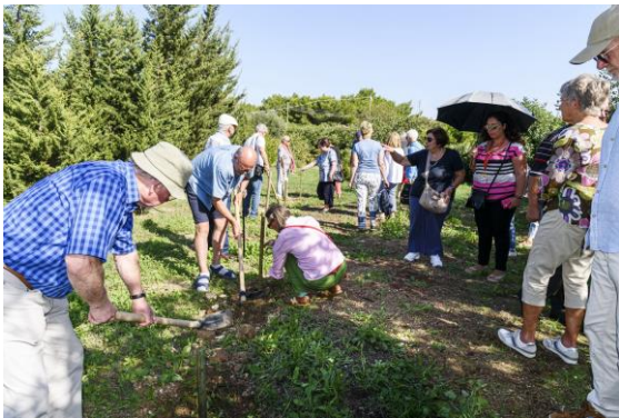
Fleißige Gärtner und Berater

GeFIS Gesellschaft zur Förderung internationaler Städtepartnerschaften Minden e.V.