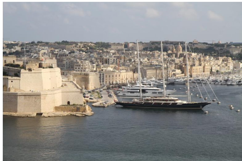
Hafen von Valetta

Seit 1990 unterstützen Mindener Bürger und Firmen und selbst die Bundeskanzlerin Angela Merkel ein Wiederaufforstungsprojekt im Zentrum der Mittelmeerinsel Malta.